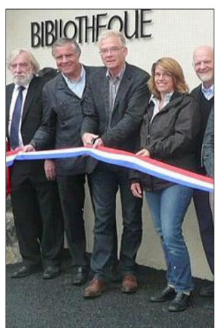
Inauguration de la bibliothèque mercredi dernier.

Vacances scolaires de Toussaint, Noël, février, printemps : lundi et vendredi de 17 h 30 à 18 h 30. Vacances scolaires estivales : lundi - mercredi - vendredi de 18 heures à 19 heures.